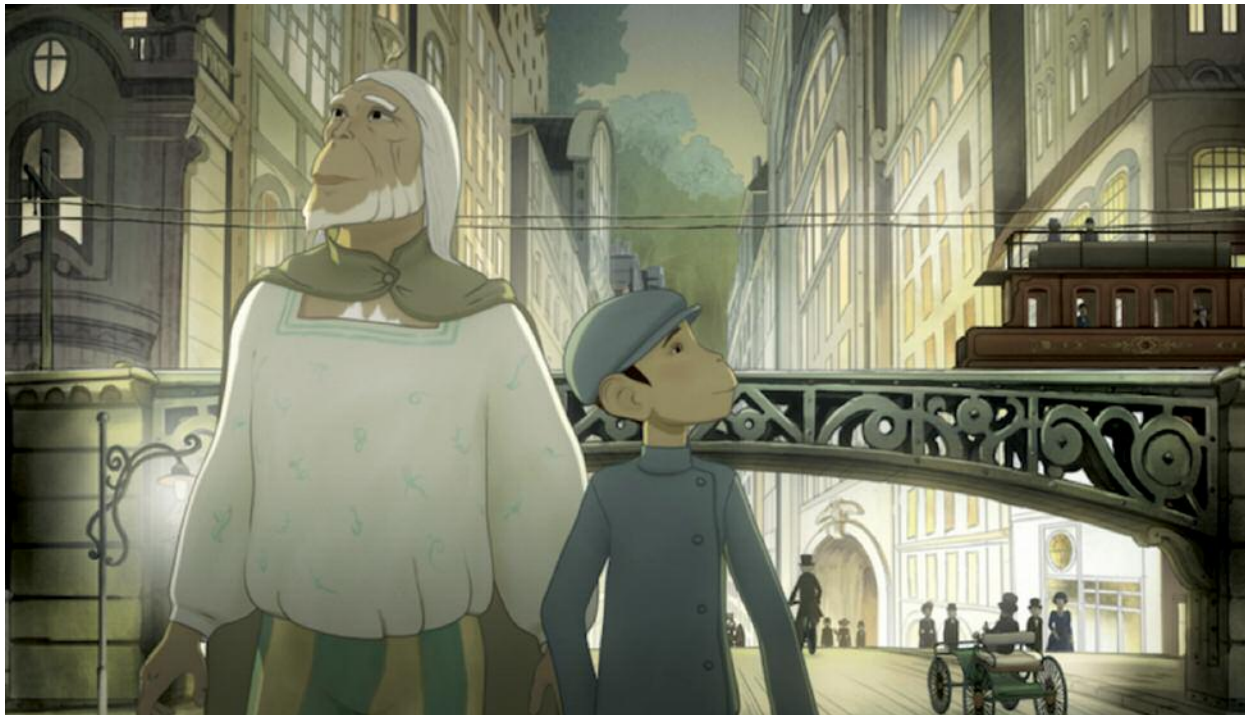
Le Voyage du Prince • Jean-François Laguionie et Xavier Picard • du 4 au 31 décembre

spectacle vivant et cinéma pour le jeune public