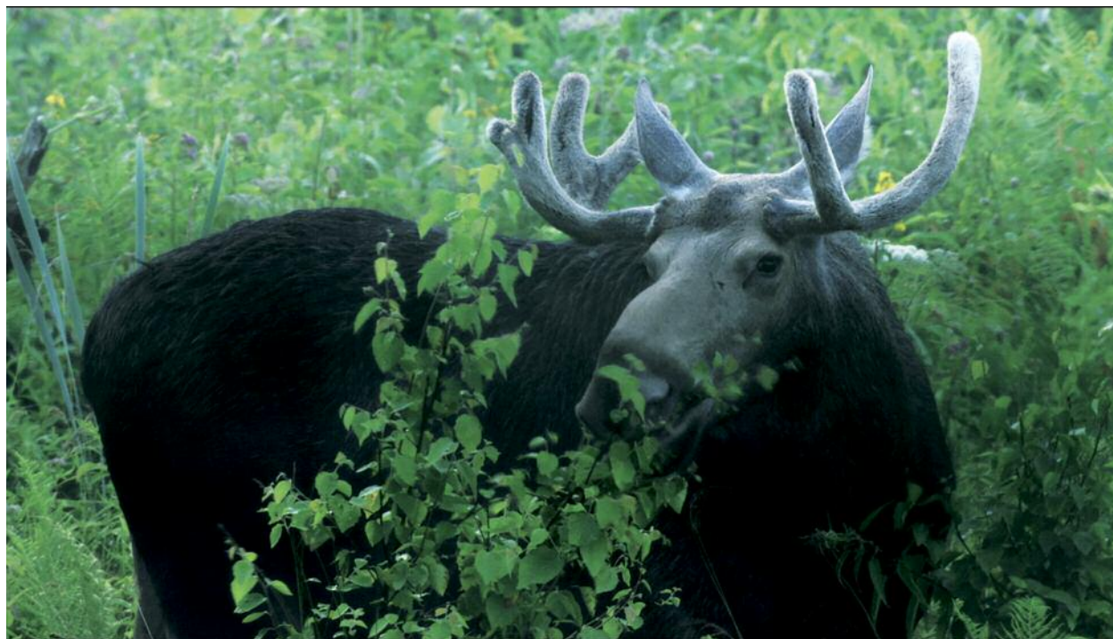
Dans les bois • Mindaugas Survila • du 3 au 16 avril

spectacle vivant et cinéma pour le jeune public