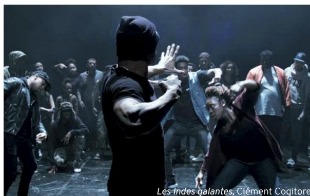
Les Indes galantes , Clément Cogitore